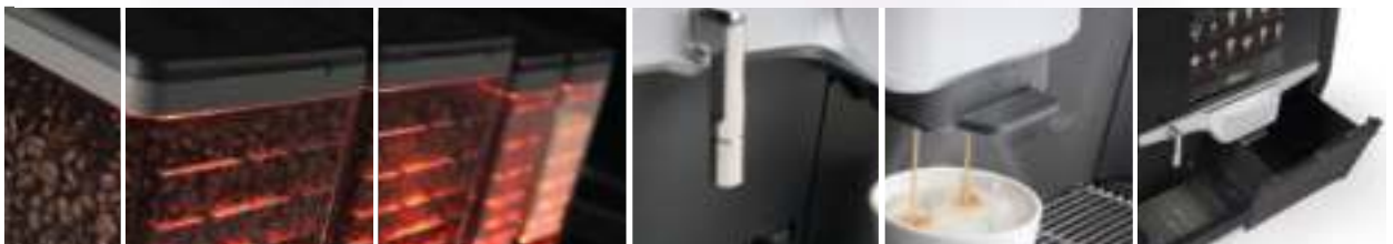
illuminated ingredient canisters